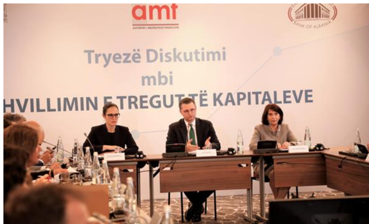
Tiranë, 26 maj 2023 – Tryezë “Mbi zhvillimin e tregjeve të kapitalit”

Dokumenti analizon situatën e tregut të kapitaleve në Shqipëri dhe infrastrukturën e tij, duke propozuar ndërmarrjen e planeve konkrete të veprimit për zhvillimin e tregut të kapitaleve përgjatë një periudhe 5-vjeçare.