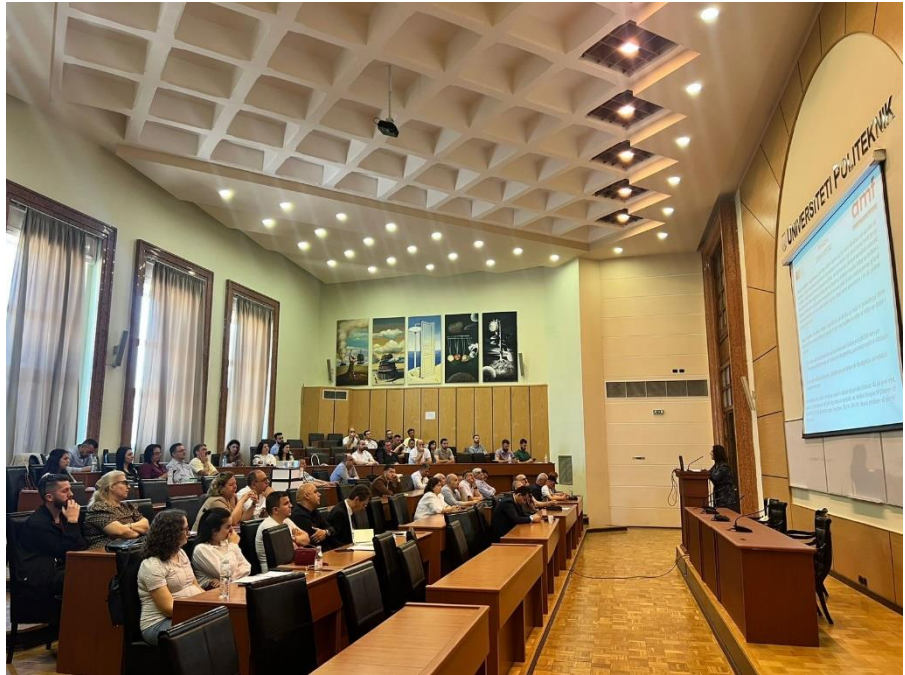
Tiranë, 24 maj 2023 – Trajnim për vlerësuesit e dëmeve në sigurime

Autoriteti i Mbikëqyrjes Financiare zhvilloi në datat 24 dhe 29 maj 2023 sesione trajnimi me vlerësuesit e dëmeve në sigurime. Në këtë trajnim morën pjesë 120 persona, profesionistët të cilët ushtrojnë veprimtarinë si vlerësues dëmsh në sigurime dhe zbatojnë programin edukim në vazhdim si dhe individët të cilët janë të interesuar për të filluar një karrierë si vlerësues dëmsh në sigurime dhe ndjekin kualifikimin profesional.