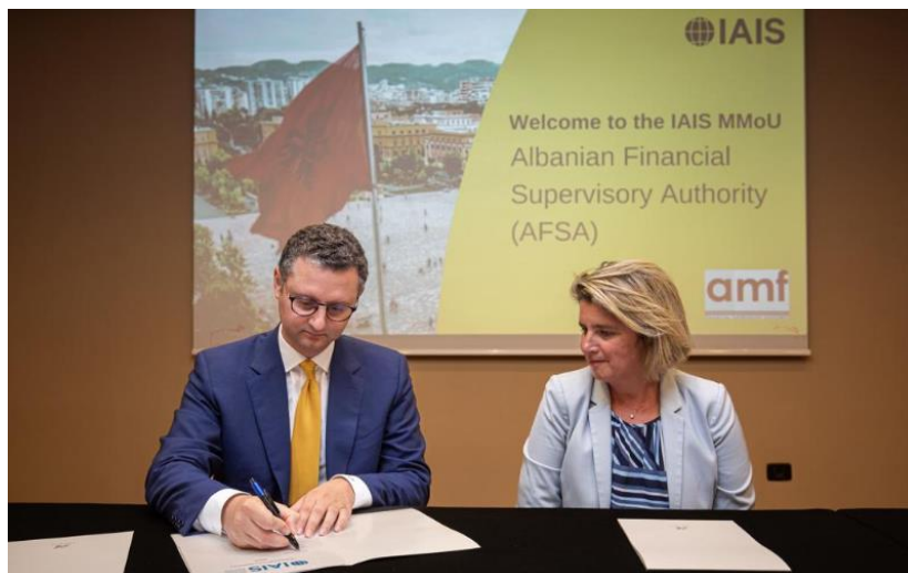
16 qershor - Drejtori i Përgjithshëm Ekzekutiv nëshkruan aderimin e AMF-së në memorandumin shumëpalësh të IAIS