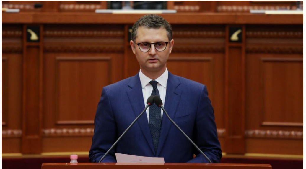
9 qershor - Drejtori i Përgjithshëm Ekzekutiv prezanton Raportin Vjetor të AMF-së në Kuvendin e Shqipërisë

Përgjatë muajve të parë të vitit 2022, tregu i sigurimeve dhe pensioneve private vullnetare kanë vijuar trendin rritës, ndërsa konstatohet një rënie e lehtë e aseteve të fondeve të investimit, ku përsëri ekspozimi i tyre ndaj luhatshmërisë së tregjeve ndërkombëtare mbetet i kufizuar.