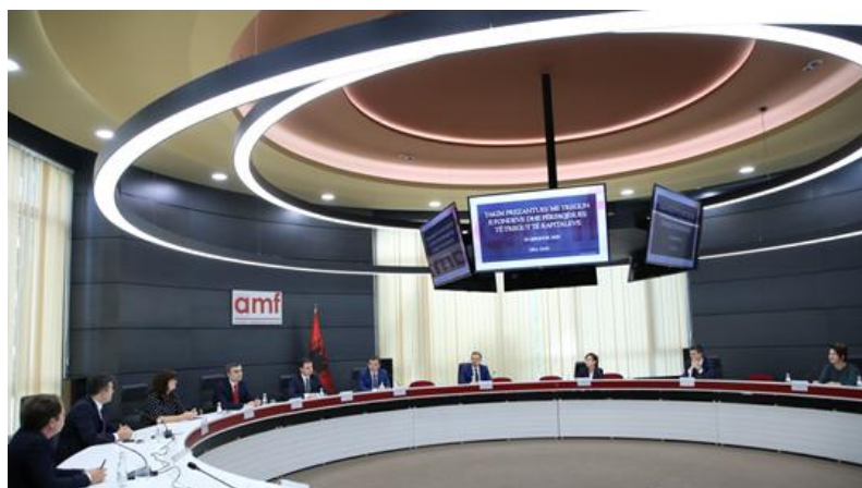
18 qershor 2020 - Takim me drejtues të shoqërive administruese të fondeve të investimit, pensioneve private vullnetare dhe përfaqësues të tregut të kapitaleve