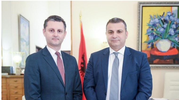
5 qershor 2020 - Takim me Guvernatorin e Bankës së Shqipërisë

Drejtori i Përgjithshëm Ekzekutiv zhvilloi gjatë muajit qershor takime me drejtues të institucioneve të vendit dhe të huaja