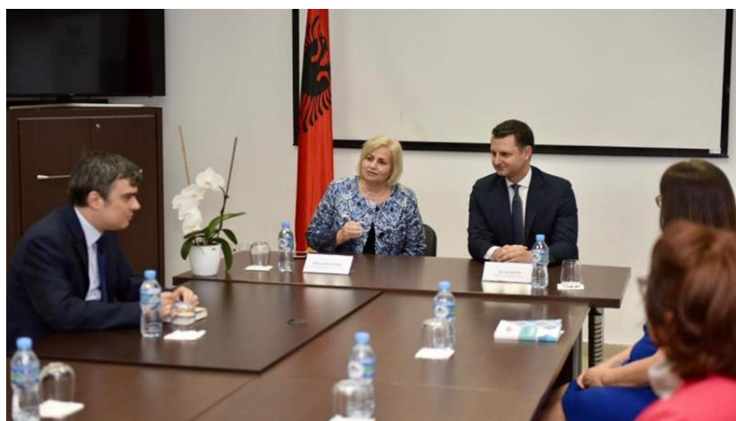
1 qershor 2020 – Prezantohet në Autoritet Drejtori i Përgjithshëm Ekzekutiv