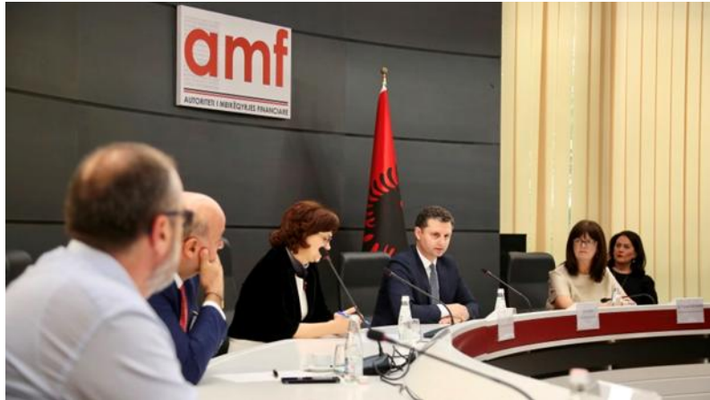
9 qershor 2020 - Takim me drejtuesit e shoqërive të sigurimit

Drejtori i Përgjithshëm Ekzekutiv i Autoritetit të Mbikëqyrjes Financiare, Z. Ervin Mete, zhvilloi gjatë muajit qershor, takime pune me drejtuesit e shoqërive të sigurimit, drejtues të shoqërive administruese të fondeve të investimit, pensioneve private vullnetare dhe përfaqësues të tregut të kapitaleve, si dhe me drejtues të lartë të bankave.