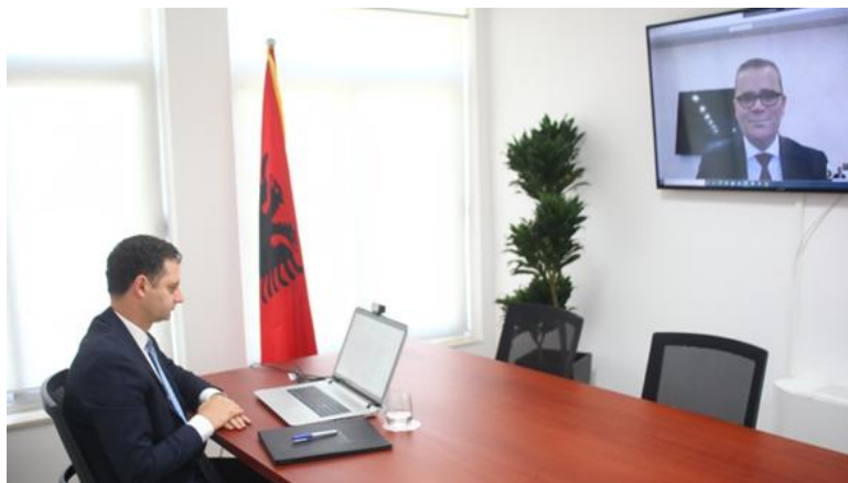
25 qershor 2020 – Takim online me Guvernatorin e Bankës Qendrore të Kosovës