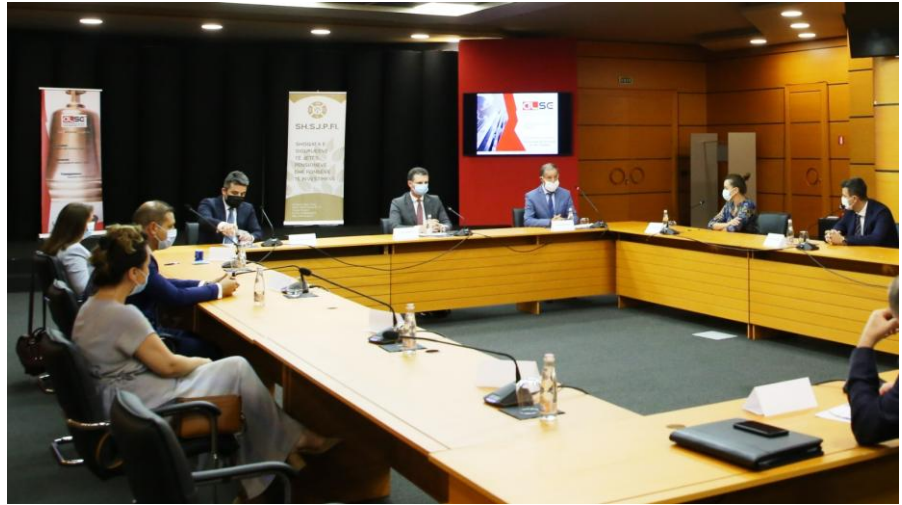
20 korrik 2020 - Lançimi i platformës së publikimit të të dhënave ditore të kuotave të fondeve të investimeve dhe pensioneve private vullnetare

Drejtori i Përgjithshëm Ekzekutiv i AMF-së theksoi se nisma të tilla rrisin transparencën dhe informimin, që janë thelbësore për natyrën e tregjeve të kapitalit, por edhe në fokusin kryesor të punës së AMF-së.