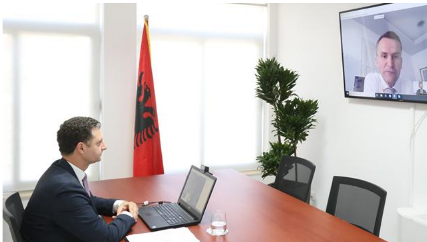
3 korrik 2020 – Takimi online me Presidentin e Agjencisë Kroate të Mbikëqyrjes së Shërbimeve Financiare

Në takim u ra dakord për finalizimin e një Memorandumi mes AMF dhe HANFA, i cili përcakton një kuadër të qartë bashkëpunimi në të ardhmen.