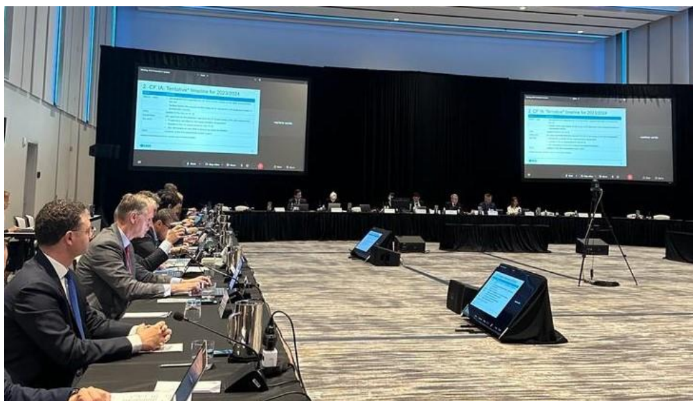
Seattle, SHBA, qershor 2023 – AMF pjesëmarrëse në mbledhjen e IAIS

Komiteti Ekzekutiv i Organizatës Ndërkombëtare të Mbikëqyrësve në Sigurime (IAIS) miratoi raportin përfundimtar të vlerësimit për Autoritetin e Mbikëqyrjes Financiare, në lidhje me përputhshmërinë me Parimet Themelore në Sigurime (ICP). Gjatë vitit 2022, Autoriteti iu nënshtrua një procesi rigoroz vlerësimi në lidhje me përputhshmërinë e standardeve dhe praktikave të AMF-së me Parimet Themelore në Sigurime (ICP).