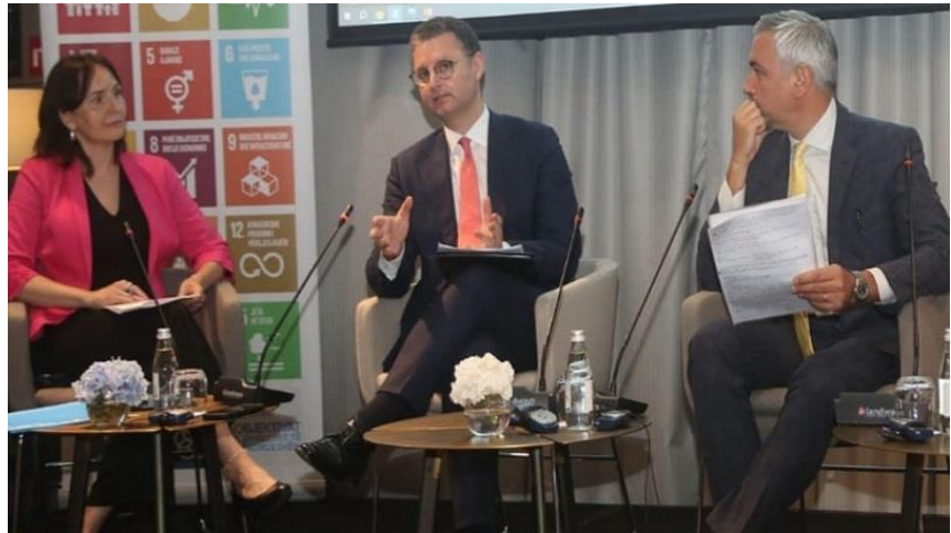
Tiranë, 26 qershor 2023 – Aktiviteti: “Financimi i Zhvillimit të Qëndrueshëm në Shqipëri”

Një ndër objektivat kryesorë të AMF-së është edhe avancimi i agjendës drejt financimeve të gjelbra dhe të qendrueshme.