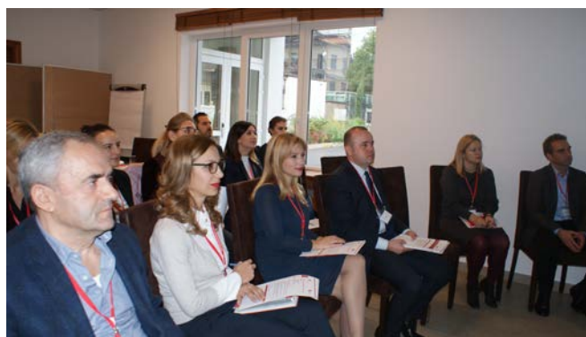
Drejtues të lartë të AMF-së së bashku me partnerë lokalë dhe ndërkombëtarë gjatë prezantimit të projektit për sigurimin vullnetar gjithëpërfshirës në vend.