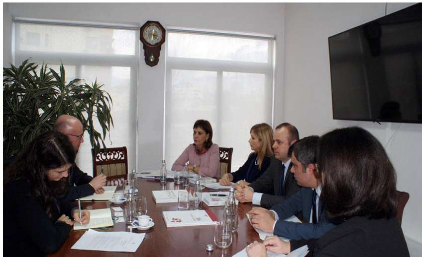
Drejtues të lartë të AMF-së dhe përfaqësues të Bankës Qendrore Evropiane gjatë takimit