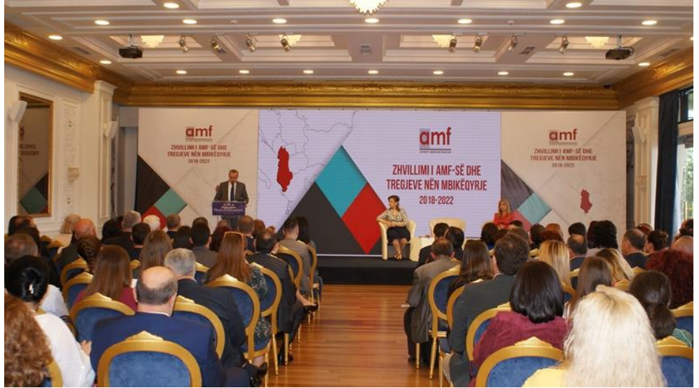
Konferenca për prezantimin e Strategjisë së AMF

Autoriteti i Mbikëqyrjes Financiare prezantoi më 14 maj 2018 Strategjinë 5-vjeçare të zhvillimit të AMF-së dhe tregjeve nën mbikëqyrje për periudhën 2018-2022.