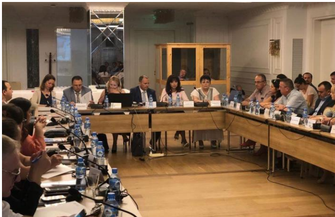
Gjatë zhvillimit të takimit

Eksperiencia sllovene në tregun e sigurimeve u prezantua në një takim me përfaqësues të tregut shqiptar të sigurimeve, tregut bankar dhe atij të mikrofinancës, të shoqatave të bujqësisë dhe turizmit, që veprojnë në vend. Tryeza e diskutimit u zhvillua me 13 qershor 2018 e organizuar në bashkëpunim midis Shoqatës së Siguruesve të Shqipërisë dhe asaj të Sllovenisë.