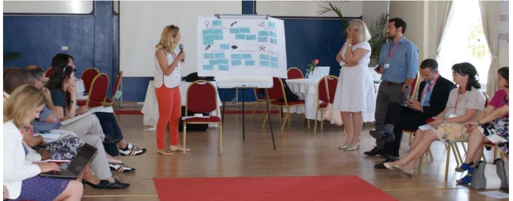
Gjatë zhvillimit të workshopit për sigurimet vullnetare gjithëpërfshirëse

Në kuadër të projektit për sigurimin vullnetar gjithëpërfshirës, në datat 19-22 qershor 2018 u zhvillua në Durrës workshopi ndërkombëtar "Inovation Incubator". Projekti mbështetet dhe financohet nga Iniciativa për Akses në Sigurime (Access to Insurance Initiative) në bashkëpunim me Akademinë për Udhëheqje Globale të GIZ (GIZ Global Leadership Academy) dhe përfundon në nëntor 2018.