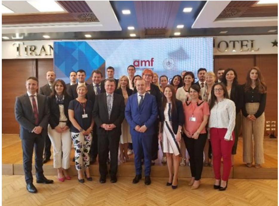
Përfaqësues të vendeve të Evropës Qendrore, Lindore dhe Juglindore në takimin e 15-të të Iniciativës për Mbikëqyrjen e Sigurimeve

Autoriteti i Mbikëqyrjes Financiare organizoi më datë 12 qershor, në Tiranë, takimin e 15-të të Iniciativës për Mbikëqyrjen e Sigurimeve të vendeve të Evropës Qendrore, Lindore dhe Juglindore, CESEE.