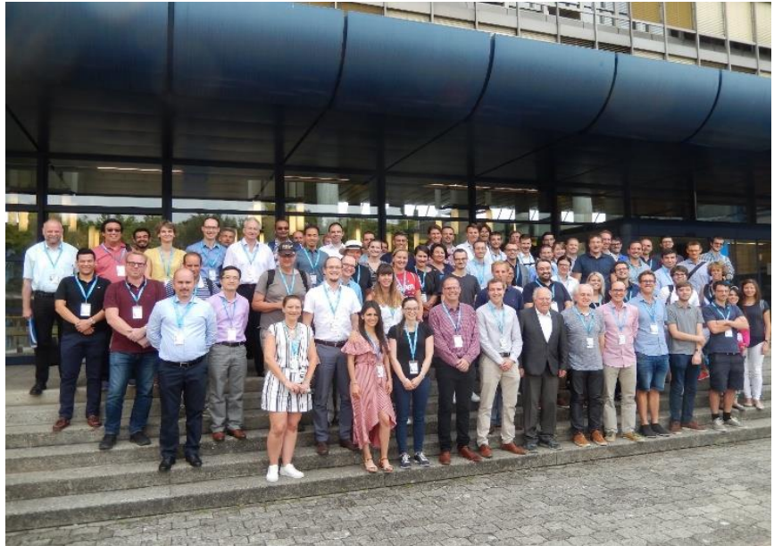
Pjesëmarrësit në shkollën ndërkombëtare verore

U trajtuan gjithashtu vetitë e modelit të përgjithshëm linear, limitet e tij, si dhe nevoja e përdorimit të teknikave të reja me fokus aplikimin e tyre në klasifikimin e risqeve, përlogaritjen e provigjoneve teknike, si dhe përcaktimin e tarifave të primit të sigurimit për një portofol të caktuar.