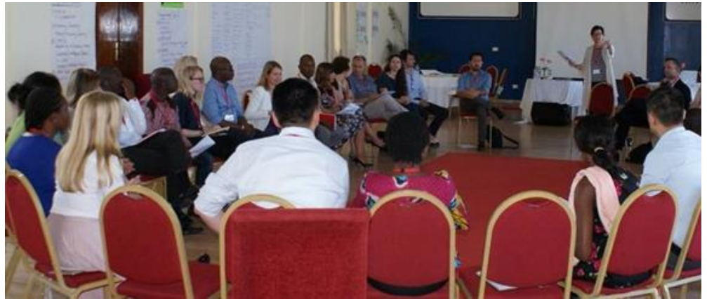
Gjatë zhvillimit të workshop-it

Gjatë këtij workshop-i tek pjesëmarrësit, u prezantua puna e ekipit të projektit për mbështetjen dhe zhvillimin e produkteve të mikrosigurimeve të fokusuara në fushën e bujqësisë. Të pranishëm në këtë workshop ishin edhe pedagogë të Universitetit Bujqësor të Tiranës, të cilët kanë mbështetur në një studim të posaçëm dhe në përvojën e tyre, dhanë opinione se si mund të zgjerohet më tej sigurimi në sektorin e bujqësisë.