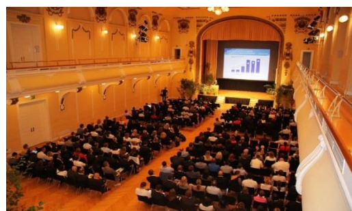
Gjatë zhvillimit të konferencës me temë: "Sigurimi në një të ardhme dixhitale"

Konferenca ka eksploruar ndikimin e rreziqeve kibernetike, mbrojtjen e të dhënave dhe të tjerëve në industrinë si tërësi, si dhe mbi konsumatorët.