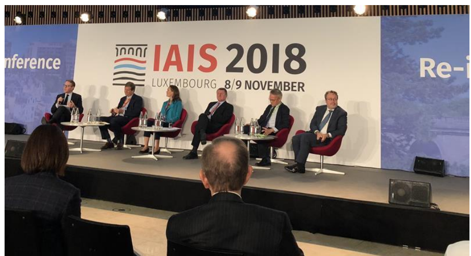
Gjatë zhvillimit të konferencës

Shoqata Ndërkombëtare e Mbikëqyrësve të Sigurimeve (IAIS) zhvilloi në datat 8-9 nëntor, në Luksenburg, Konferencën e 25-të Vjetore, e cila u parapri nga Mbledhja e Përgjithshme Vjetore e Anëtarëve dhe nga mbledhjet e Komitetit.