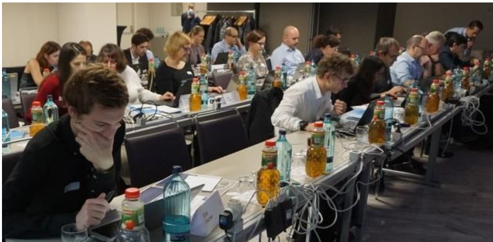
Gjatë zhvillimit të seminarit

Akademia Aktuariale Evropiane në bashkëpunim me Kolegjin e Aktuarëve të Katalonjës zhvilluan në datat 15–16 nëntor, në Barcelonë, Spanjë, seminarin me titull “Modelet parashikuese për jetën dhe shëndetin” me pjesëmarrjen e aktuarëve dhe ekspertëve të tregut të sigurimeve nga 20 vende të ndryshme të Botës.