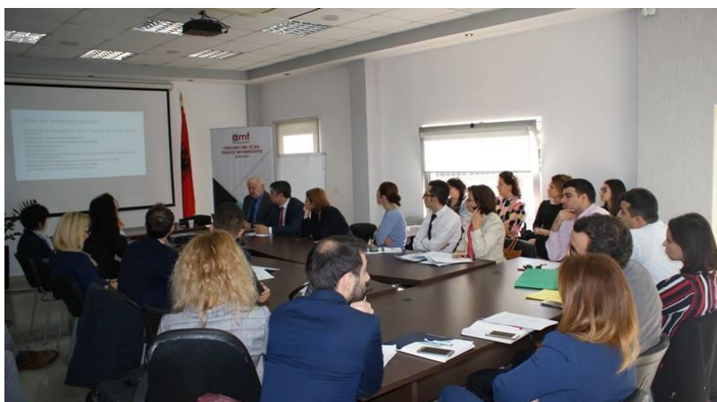
Gjatë zhvillimit të workshopit

Dokumenti i prezantuar nga konsulentët në kuadër të fazës së dytë të projektit “Forcimi i Kapaciteteve të Autoritetit të Mbikëqyrjes Financiare: Fokusi tek Zhvillimi i Tregut të Kapitaleve”, është hartuar në përputhje me direktivat e Bashkimit Evropian.