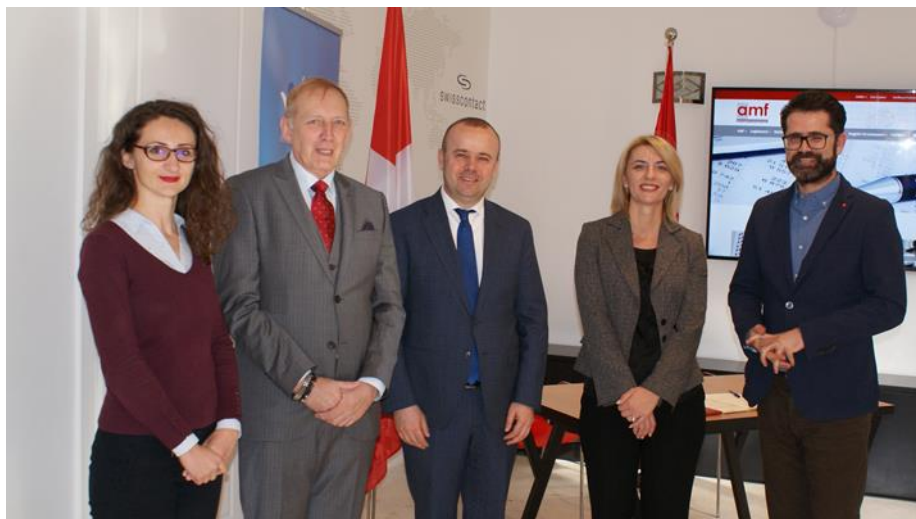
Në ambientet e Swisscontact për nënshkrimin e marrëveshjes

Autoriteti i Mbikëqyrjes Financiare ka nënshkruar më 11 dhjetor 2018, një marrëveshje bashkëpunimi me projektin e Swisscontact “Aftësi për Punë, S4J”. Në vazhdim të zbatimit të “Strategjisë për rritjen e besimit të konsumatorit/investitorit në tregjet financiare nën mbikëqyrje”, AMF zgjeron grupet e interesit në fushatën e nisur për rritjen e edukimit financiar.