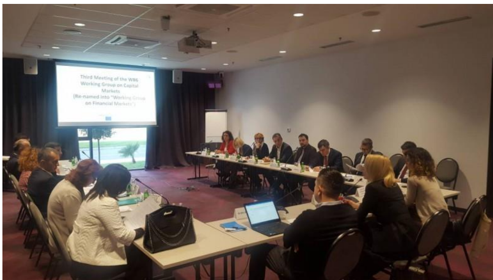
Gjatë zhvillimit të takimit

Grupi rajonal i punës për tregjet e kapitaleve i themeluar më parë përgatiti një propozim për një program rajonal për zhvillimin e tregjeve të kapitalit, i cili iu është përcjellë për shqyrtim kryeministrave të rajonit në kuadër të "Procesit të Berlinit" dhe Samitit të WB6 që u zhvillua në Londër, korrik 2018. Duke pasur parasysh punën e bërë më parë në tregjet e kapitalit, takimi do të synojë gjithashtu të vazhdojë me këtë punë pa humbur ritmin e avancimit duke synuar përparimin në kapitullin e tregjeve të kapitalit dhe strategjisë së përgjithshme të tregjeve financiare.