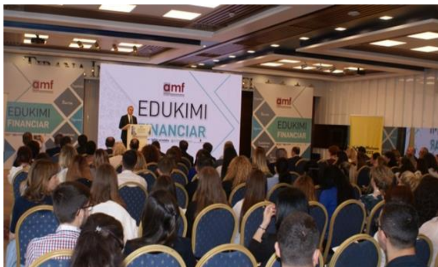
Momente nga konferenca “Edukimi Financiar”, zhvilluar në maj 2018

—○○○— Në konferencë ftohen të marrin pjesë studentë dhe pedagogë nga universitete të ndryshme të vendit për të prezantuar punimet më të mira për tregjet nën mbikëqyrjen e Autoritetit. —○○○—