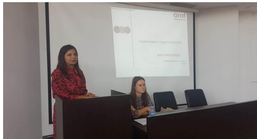
Gjatë takimit informues me studentë e pedagogë në universitetin "Aleksandër Moisiu" në Durrës, 1 tetor 2019.