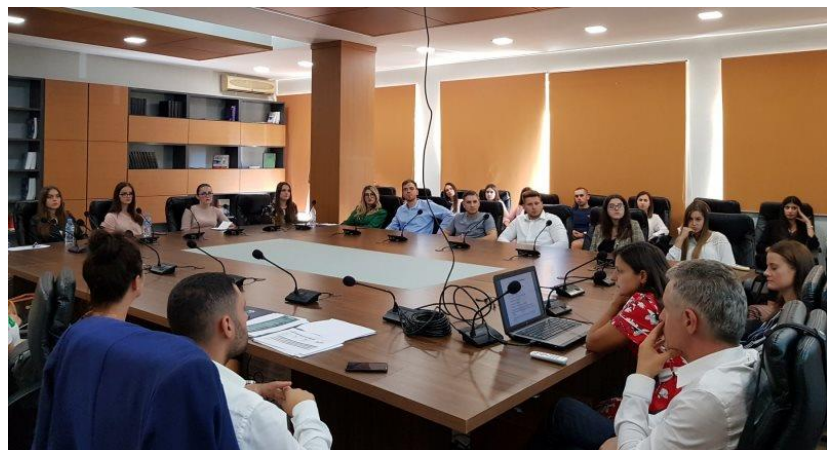
Gjatë takimit me studentë dhe pedagogë të Fakultetit të Ekonomisë të Universitetit të Tiranës, 2 tetor 2019.