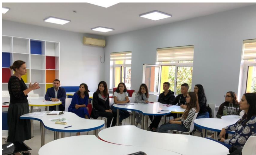
Gjatë takimit informues me nxënësit e Shkollës së Mesme Profesionale "Kristo Isak" në Berat, 4 tetor 2019.