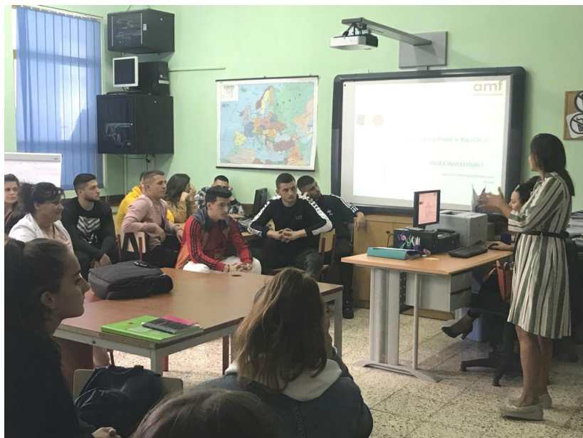
Gjatë takimit informues me nxënës të Shkollës së Mesme Teknike Ekonomike në Tiranë, 3 tetor 2019.