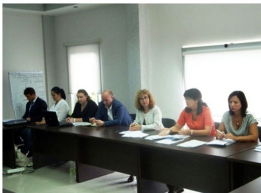
Gjatë zhvillimit të tryezës së rrumbullakët

Autoriteti i Mbikëqyrjes Financiare organizoi në datë 10 shtator 2015, takimim me përfaqësues të shoqërive të sigurimit, Shoqatës së Siguruesve dhe Byrosë Shqiptare të Sigurimit, për diskutimin e ndryshimeve në Ligjin nr. 10 076, datë 12.2.2009 “Për sigurimin e detyrueshëm në sektorin e transportit”. Takimi pati karakter konsultativ, gjatë të cilit u parashtruan komente dhe sugjerime në lidhje me përmirësime apo rregullime të mëtejshme që mund t'i bëhen draftit të përgatitur nga ekspertët e AMF-së.