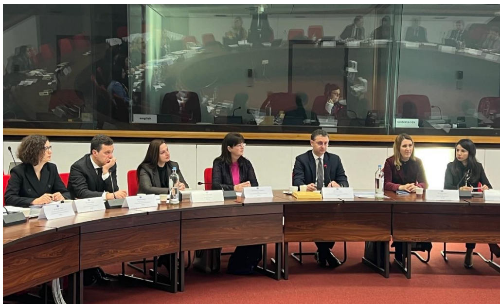
Bruksel, 13-14 shkurt 2022 – AMF takimet bilaterale për Kapitullin 9-të “Shërbimet financiare”