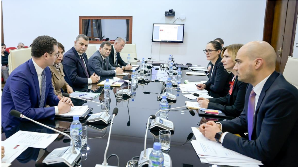
Tiranë, 29 dhjetor 2021 – Takimi i Grupit Këshillimor të Stabilitetit Financiar

Në datën 29 dhjetor 2021, u zhvillua mbledhja e Grupit Këshillimor të Stabilitetit Financiar (GKSF). Në këtë mbledhje, e cila u drejtua nga Ministria e Financave dhe Ekonomisë, morën pjesë Guvernatori i Bankës së Shqipërisë (BSH), Kryetari i Bordit të Autoritetit të Mbikëqyrjes Financiare (AMF), Drejtori i Përgjithshëm i AMF-së, Drejtori i Përgjithshëm i Agjencisë së Sigurimit të Depozitave (ASD) dhe përfaqësues të tjerë të këtyre institucioneve.