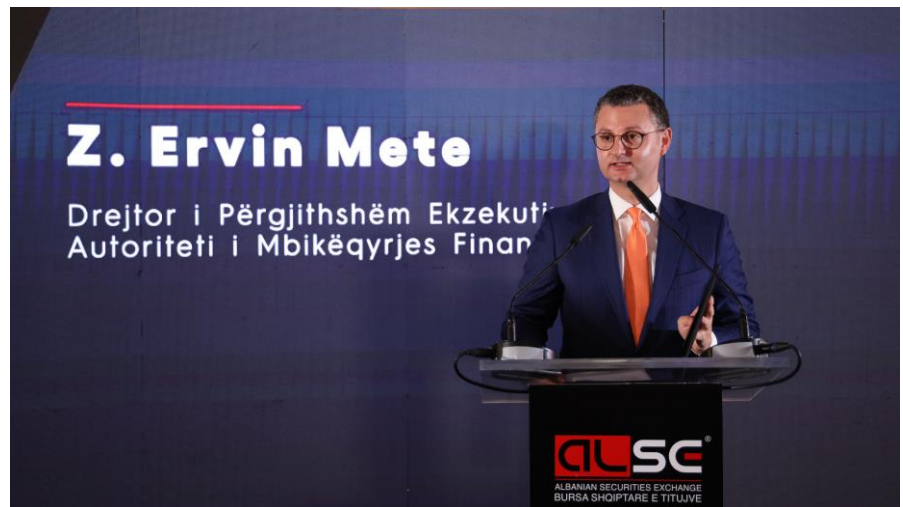
Tiranë, 5 korrik 2023 - Ceremonia e listimit të instrumentit të parë joqeveritar në Bursën Shqiptare të Titujve, ALSE