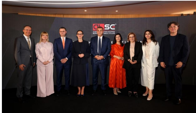
Tiranë, 5 korrik 2023 - Ceremonia e listimit të instrumentit të parë joqeveritar në Bursën Shqiptare të Titujve, ALSE