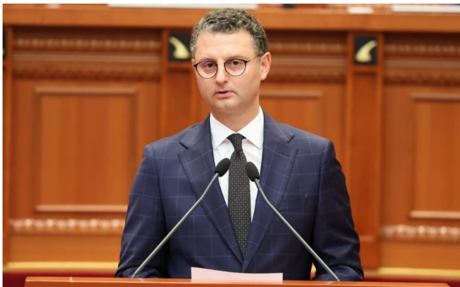
Tiranë, 20 korrik 2023 – Raportimi në Kuvendin e Shqipërisë për vitin 2022