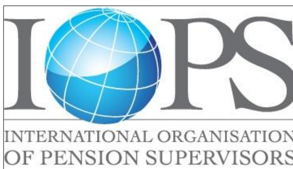
Organizata Ndërkombëtare e Rregullatorëve të Pensioneve (IOPS)

Shqipëria do të organizojë për herë të parë Forumin Global 2019 të Organizatës Ndërkombëtare të Rregullatorëve të Pensioneve (IOPS). Vendimi është marrë në mbledhjen e anëtarëve të Komitetit Ekzekutiv të IOPS-it në 22 shkurt 2018 në Dublin, Irlandë dhe i është bërë i ditur zyrtarisht Autoritetit të Mbikëqyrjes Financiare në fillim të këtij muaji.