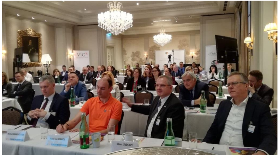
Gjatë zhvillimit të konferencës

Organizata Ndërkombëtare e Medias XPRIMM zhvilloi në datë 16 mars Vjenë, Austri konferencën me temë: “Sigurimi motorik – Sfida e inovacionit”. Gjatë zhvillimit të kësaj konference u trajtuan tema të rëndësishme që lidhen me sfidat e inovacionit në sigurimin motorik për vendet e Evropës. Sfida e inovacionit ishte një mjedis i nivelit të lartë për shkëmbimin e njohurive të biznesit për çështjet thelbësore të industrisë së sigurimeve motorike, si dhe një pikë takimi për tendencat e fundit në inovacionin teknologjik.