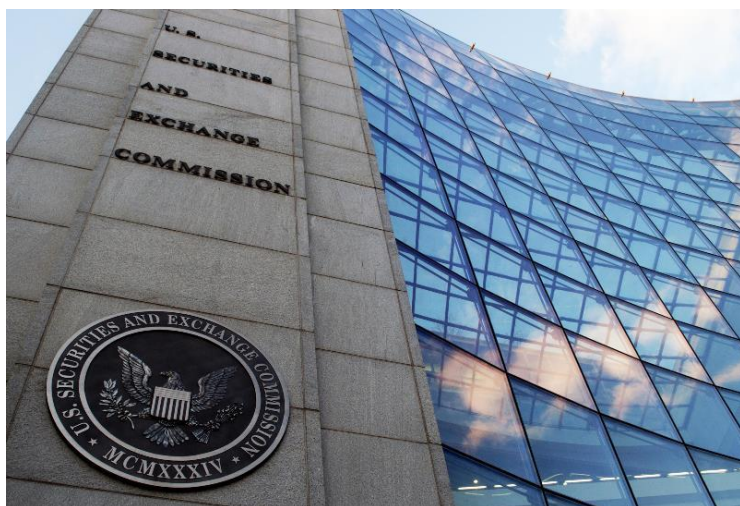
Ndërtesa e U.S. Securities and Exchange Commission, SEC

Komisioni i Letrave me Vlerë i SHBA-së ( United States Securities & Exchange Commission, SEC ) zhvilloi në datat 11-22 mars, në Washington, SHBA, konferencën e 28-të vjetore me temë “Rritja dhe zhvillimi i tregut të titujve”.