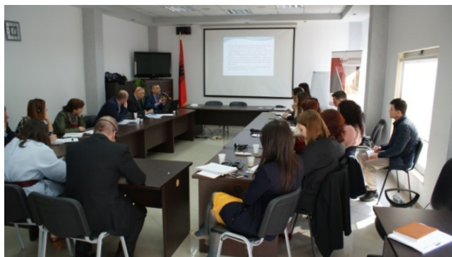
Gjatë zhvillimit të trajnimit të asistencës teknike dhe këmbimit të informacionit (TAIEX) të Komisionit Evropian në ambientet e AMF-së

Autoriteti i Mbikëqyrjes Financiare në kuadër të aplikimit në instrumentin e asistencës teknike dhe këmbimit të informacionit (TAIEX) të Komisionit Evropian organizoi në datat 15–16 mars 2017 trajnimin në formën e misionit të ekspertëve ( Expert Mission ) për Sigurimin e Detyrueshëm në Sektorin e Transportit. Ky aktivitet u organizua si bashkëpunim i Komisionit Evropian me IVASS (Autoriteti Italian i Sigurimeve).