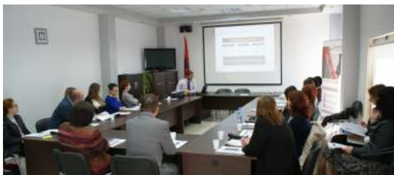
Gjatë zhvillimit të trajnimit mbi abuzimin e tregut dhe tregtimin e brendshëm në fushën e titujve

○ ○ ○ Trajnimi ( Expert Mission ) për legjislacioni e ri të BE-së në lidhje me abuzimet e tregut dhe tregtimin e brendshëm të titujve ( Market abuse and inside trading ).