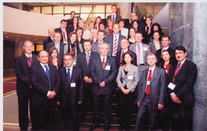
Regional Conference Sarajevo, September 29th, 2008

Agjencia e Sigurimeve të Bosnje Hercegovinës në bashkëpunim me Komisionin e Mbikëqyrjes Financiare të Republikës Bullgare, zhvilloi në Sarajevë, Bosnje Hercegovinë, më datë 29 shtator 2008, konferencën rajonale mbi Tregun e Sigurimeve në Evropën Juglindore dhe Evropën Qendrore si dhe rregulloret e tyre.