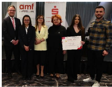
Skuadra fituese e studentëve të Universitetit të New York në Tiranë