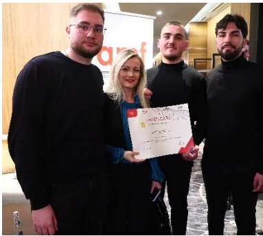
Skuadra fituese e studentëve të Universitetit Luarasi

Autoriteti i Mbikëqyrjes Financiare do të vijojë aktivitetet për nxitjen e edukimit dhe gjithëpërfshirjes financiare, si ndër objektivat kryesorë të tij.