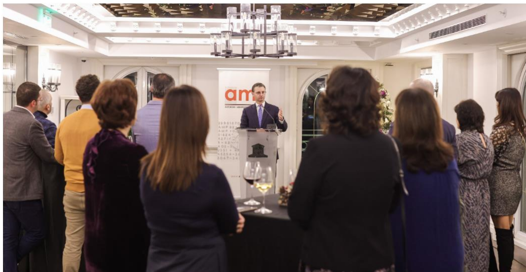
Tiranë, 28 dhjetor 2022 – AMF takim me median