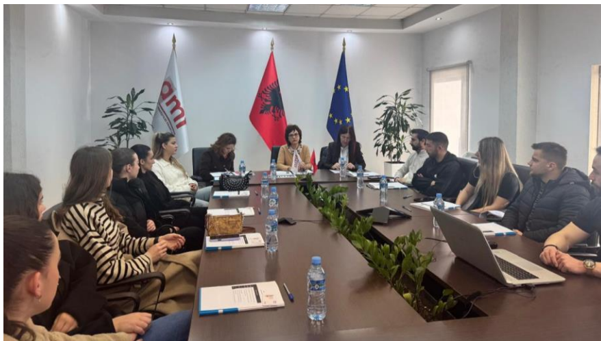
Tiranë, 22 janar 2025 – Leksion i hapur në AMF me studentët e Albanian University

Autoriteti i Mbikëqyrjes Financiare organizoi më 22 janar 2025, një leksion të hapur me studentë të degës së financës të Albanian University. Në leksion u prezantua roli i Autoritetit dhe funksionet e tij në drejtim të mbikëqyrjes dhe rregullimit të tregjeve financiare jobankare, duke u fokusuar kryesisht në tregun e sigurimeve. Studentëve ju prezantua kuadri ligjor që drejton këto tregje si edhe puna që Autoritetit bën për mbrojtjen dhe informimin e konsumatorit e investitorit. Në leksion u prezantua edhe tërësia e publikimeve statistikore të cilat gjenden në faqen web të Autoritetit dhe që mund të përdoren nga studentët për të realizuar punimet e tyre të diplomës.