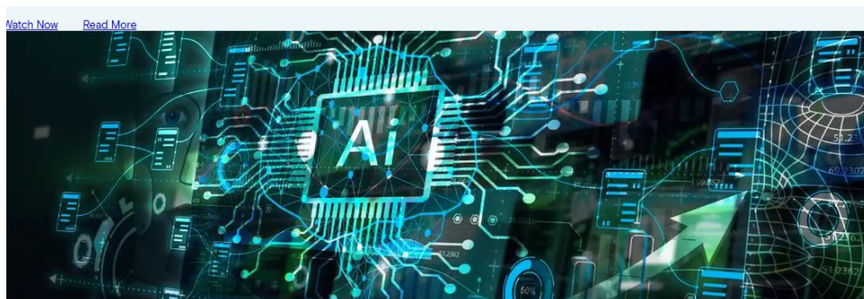
IOSCO publishes new Consultation Report on AI in Capital Markets

Programi i plotë i punës i IOSCO-s gjendet në: OR/01/2025 IOSCO 2025 Work Program