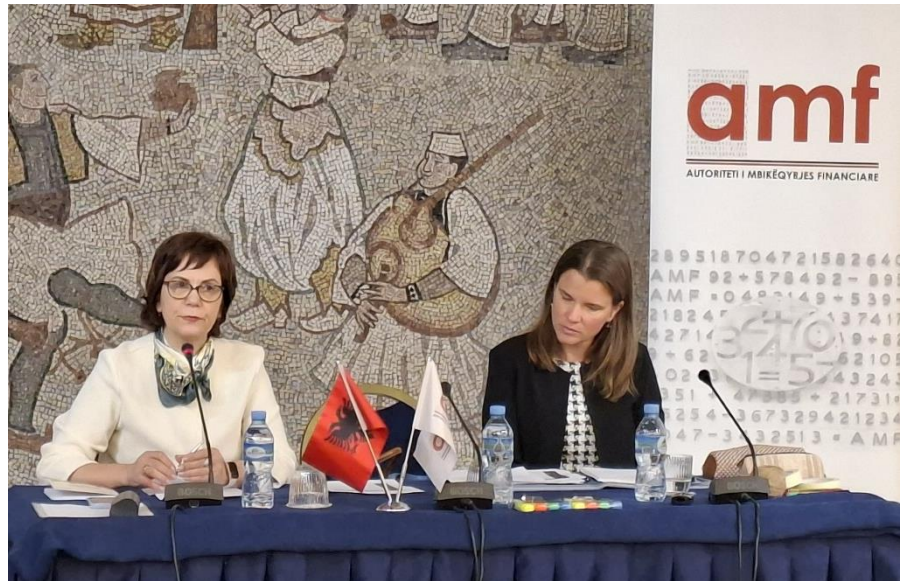
Tiranë, 9 Dhjetor 2025 – Workshop për trajnimin e trajnerëve në sigurime

Autoriteti i Mbikëqyrjes Financiare organizoi workshop-in për Trajnimin e Trajnerëve në tregun e sigurimeve. Ky workshop është pjesë e projektit që synon rritjen e edukimit financiar të publikut dhe mbështetet nga Zyra e Asistencës Teknike (OTA) të Departamentit Amerikan të Thesarit të Shtetit.