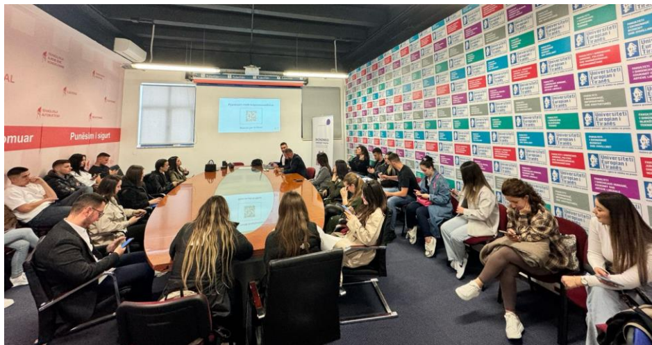
Tiranë - 22 prill 2024, leksion me studentët e Universitetit Evropian të Tiranës.

Autoriteti i Mbikëqyrjes Financiare zhvilloi ditën e hënë, datë 22 prill 2024, leksione të hapura me studentët e Universitetit Marin Barleti dhe Universitetit Evropian të Tiranës. Tematika e këtyre leksioneve fokusohet në teknologjinë BlockChain dhe tregjet e kriptomonedhave.