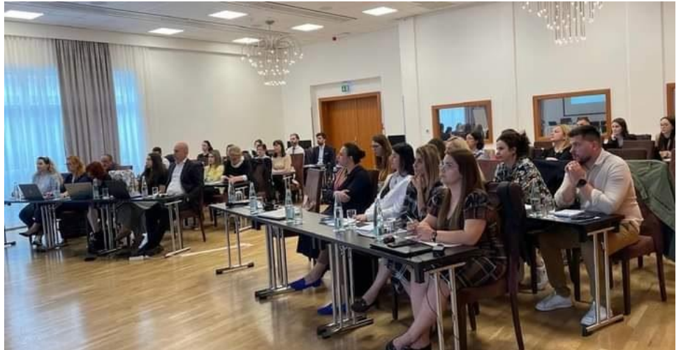
Tiranë - prill 2024, 16 prill 2024, trajnim për IFRS 17

Në datat 16-18 prill 2024, u zhvillua trajnimi për Standardin Ndërkombëtar të Raportimit Financiar, SNRF 17, “Kontratat e Sigurimit”. Autoriteti i Mbikëqyrjes Financiare ka ndërmarrë një sërë hapash për të rritur kapacitet teknike të specialistëve të mbikëqyrjes dhe stafeve teknike të shoqërive të sigurimit në vend, për zbatimin e SNRF 17. Qëllimi kryesor i këtij trajnimi ishte përvetësimi i njohurive të nevojshme për të kuptuar dhe zbatuar këtë standard në tregun e sigurimeve. Në modulën e parë u trajtuan tematika që lidheshin me: (i) Sfidat kryesore që sjell zbatimi i SNRF 17; (ii) Lidhja e tij me standardin SNRF 9; (iii) Krahasimi me SNRF 4; (iv) Kontratat, testimi dhe kufijtë e tyre; (v) Konceptet aktuariale dhe roli i aktuarëve; etj.