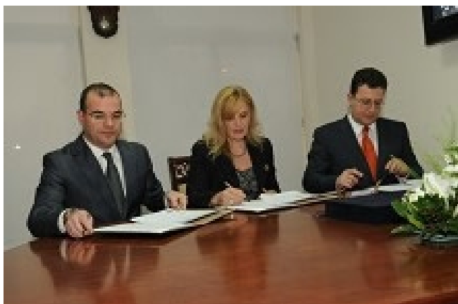
Gjatë nënshkrimit të marrëveshjes

Më datë 31 mars 2011, në ambientet e Autoritetit të Mbikëqyrjes Financiare, gjatë ceremonisë së inaugurimit të godinës së re, u zhvillua ceremonia e nënshkrimit të Marrëveshjes së Bashkëpunimit dhe Shkëmbimit të Informacionit, për Sigurimin e Detyrueshëm në Sektorin e Transportit, midis Autoritetit të Mbikëqyrjes Financiare, Ministrisë së Brendshme dhe Ministrisë së Punëve Publike dhe Transportit.