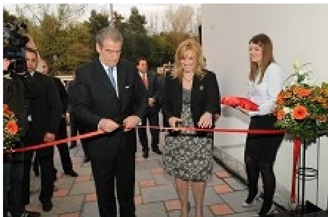
Gjatë ceremonisë së inaugurimit të godinës së re të AMF-së