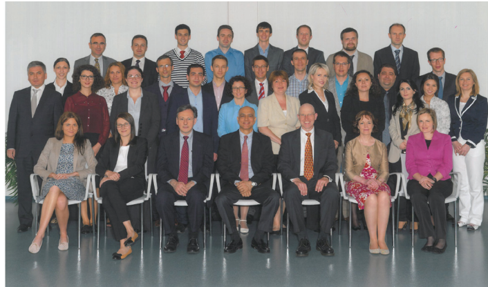
Joint Vienna Institute

Instituti Joint Vienna Institute është një qendër ndërkombëtare trajnimi që ofron kurse për zyrtarë dhe menaxherë nga vendet e Evropën Qendrore, Lindore dhe Juglindore, Komonuelthi i Shteteve të Pavarura, dhe Azia. Instituti është ngritur në vitin 1992 nga pesë organizata ndërkombëtare dhe me mbështetjen e autoriteteve austriake për t’iu përgjigjur kërkesës nga ekonomitë në tranzicion për të trajnuar mbi ekonominë e tregut dhe sistemin e lirë të ndërmarrjeve.