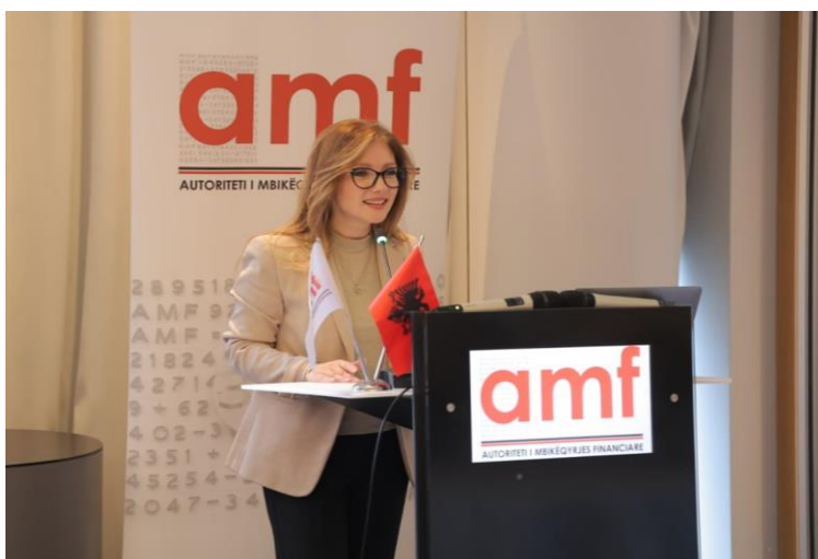
25 Nëntor 2025, Tiranë – Tryezë diskutimi mbi Vlerësimin e Ndikimit të Politikave për obligacionet e mbuluara

Autoriteti i Mbikëqyrjes Financiare organizoi një tryezë diskutimi dy ditore, mbi Vlerësimin e Ndikimit të Politikave për obligacionet e mbuluara, me synim përgatitjen e bazës ligjore në përputhje me standardet dhe praktikën e Bashkimit Evropian. Aktiviteti, i mbështetur nga GIZ në kuadër të projektit SANECA II, mbledhi përfaqësues të institucioneve publike, aktorëve të tregut dhe ekspertë ndërkombëtarë.