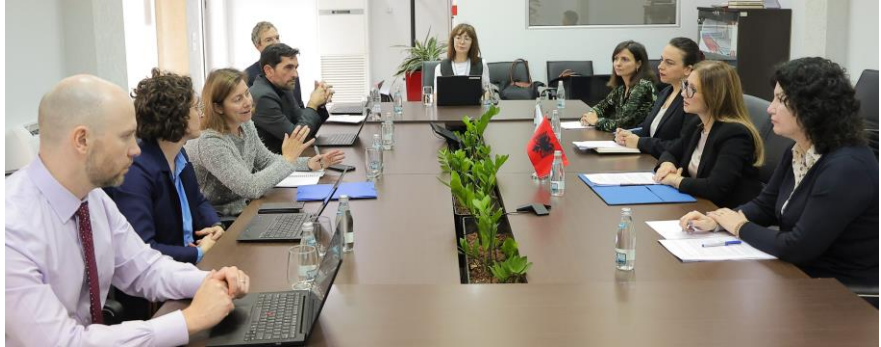
Tiranë, 7 Nëntor 2025 - Takimi AMF - Misionin e Fondit Monetar Ndërkombëtar